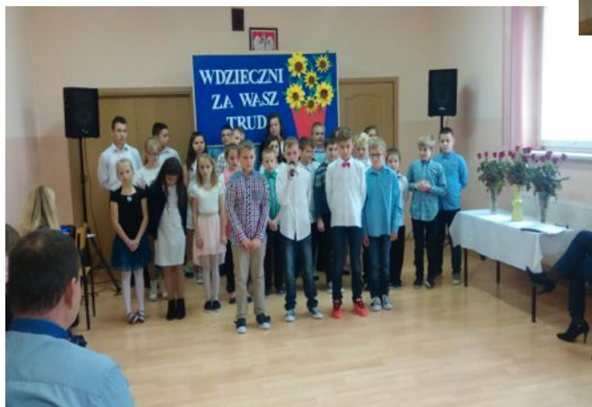
Uczniowie podczas akademii

„Nauczyciel... to przewodnik i lider, sternik łodzi. Jednakże energia, która tę łódź napędza, musi pochodzić od uczących się”.