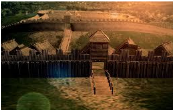
Karpacca Troja w promieniach słońca.

W trakcie interdyscyplinarnych badań prowadzonych w Trzcinicy w latach 1991-98, 2005-2009 odkryto ponad 160 tysięcy zabytków archeologicznych i przebadano konstrukcje obronne. Znalaziono duże ilości glinianych naczyń oraz inne wyroby z ceramiki. Odkryto liczne wyroby kościane i rogowe, kamienne i krzemienne, unikalne zabytki z brązu i żelaza. Znalaziono dowody dalekosiężnych kontaktów. Odkryto przedmioty kultu, wytwory sztuki pradziejowej, narzędzia, broń i ozdoby. Uzyskano wiele danych dotyczących chronologii badanych osad oraz gospodarki i środowiska naturalnego. Niezwykle cenny okazał się srebrny skarb wczesnośredniowieczny, składający się z monet, różnego rodzaju ozdób, kawałków srebra i unikalnego okucia pochwy miecza. Przez cały okres funkcjonowania obiektu obronnego w Trzcinicy nakładały się tu i łączyły różnorodne wpływy kulturowe. Dokonane w Trzcinicy odkrycia przyniosły wiele nowych danych dla poznania początków epoki brązu w tej części Europy oraz wczesnośredniowiecznych grodzisk słowiańskich. Szczególna wartość historyczna i kulturowa tego miejsca, związki z kulturami basenu Morza Śródziemnego sprawia, że nazywane jest także „Karpaccą Troją”.