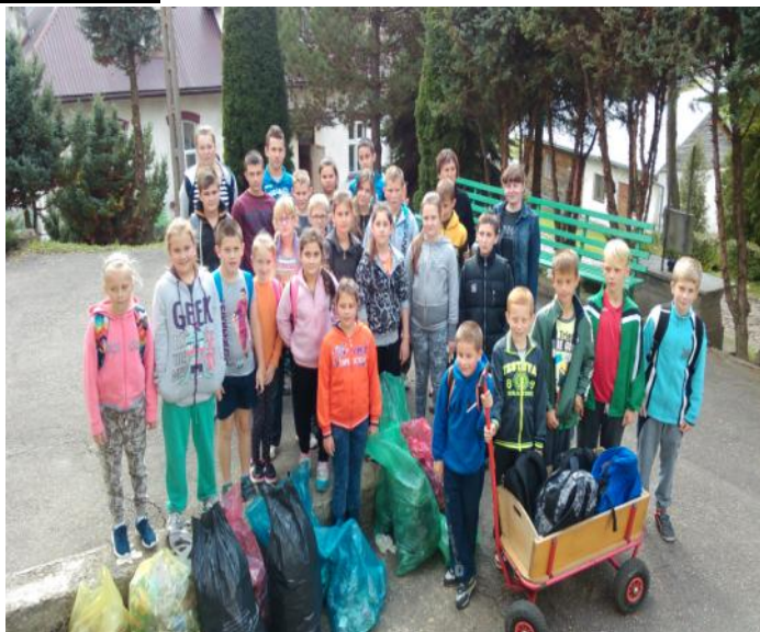
Klasy IV, V i VI sprzątają