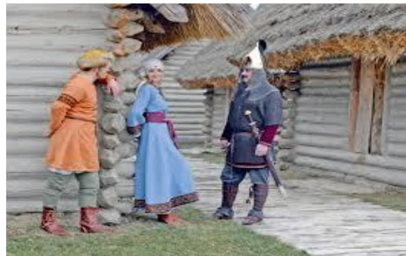
Życie w osadzie warownej.